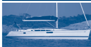
Sun Odyssey 49i