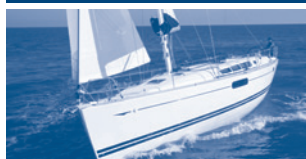
Sun Odyssey 44i Performance