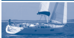
Sun Odyssey 44i